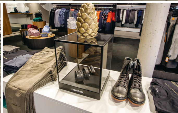
▼ Shopping-Erlebnis auf 3 Etagen: So präsentiert sich das neue FALCON in Zell am See!

Das Haus in der Dreifaltigkeitsgasse 3 in Zell am See erstrahlt in neuer Herrlichkeit! Nach dem kompletten Neuaufbau ist das Prunkstück des Gebäudes der visionäre Falcon Life & Style-Store. Er verspricht hochwertiges Shopperlebnis für Sie und Ihn auf drei Ebenen! Apropos hochwertig: Das ist auch die Bauweise mit interessanten Ein- und Ausblicken sowie die atmosphärische Inneneinrichtung des neuen „Modetempels“ in der Zeller Fußgängerzone. Stein, Holz und Metall dominieren als Materialien, „Industrial-Art“ mit Sichtbeton ist ebenso an Bord wie ein hochwertiges Beleuchtungskonzept („Fokuspunkte“) im gesamten Store.